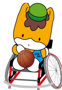
群馬県のマスコット 「ぐんまちゃん」